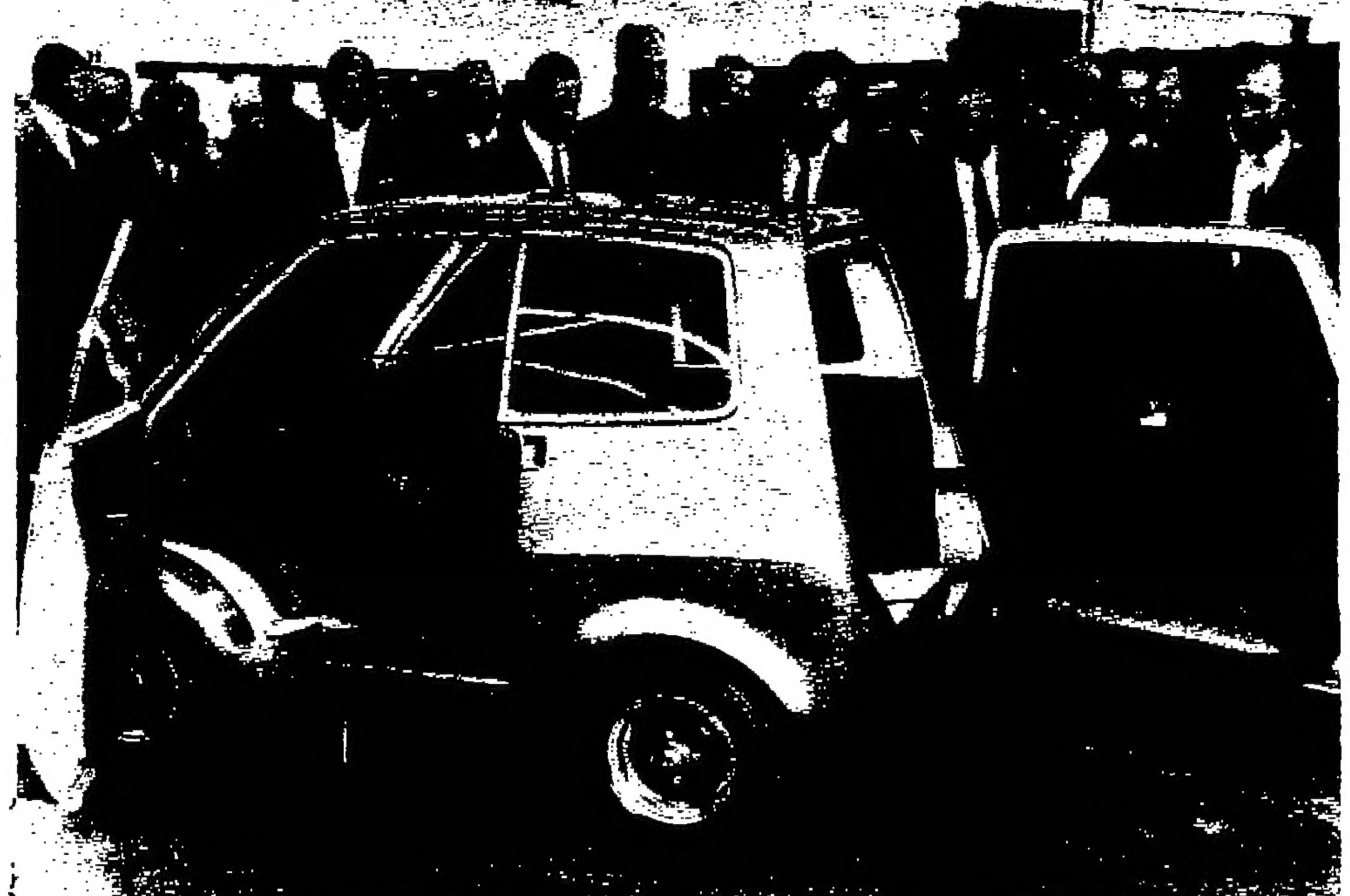
نولج لاسي « سيارة المستقبل داخل المدن » يمرض في افتتاح مركز غورد الجديد للخدمات والتمهات فيسركولون بالمانيا الغربية وتتسع السيارة لراكبين ولها ١٥٥٠ ارباب وهي مثابة جدا لائقها في الامكان الفيقيصة - تصوير اليونانيديرس «

« وينبغي منه الآن ان نواصل عملية الترجمة ، ترجمة الآتوال الى افعال ، وان يطلع علينا وجه جديد للكرامة ، وهو ترجمة الآتوال الى اموال ، ان كنا جادين .